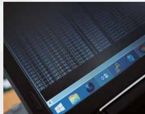
Fachinformatiker/-in – Anwendungsentwicklung