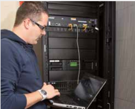
Fachinformatiker/-in – Systemintegration

Fachinformatiker für Systemintegration analysieren und pflegen bestehende IT-Systeme. Sie unterstützen den Vertrieb bei der Konzeption und Konfiguration neuer Netzwerkumgebungen.