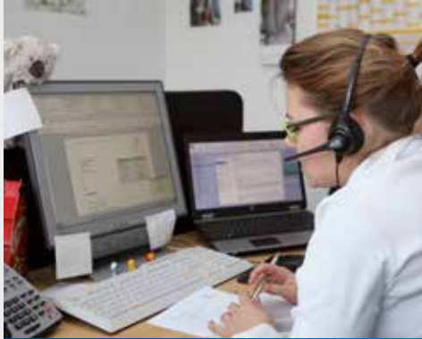
Kaufmann/-frau für Büromanagement

Kaufleute für Büromanagement bilden die Schnittstelle zwischen Vertrieb und Technik indem sie sowohl Termine koordinieren als auch den Schriftverkehr und die Beschaffungsvorgänge bearbeiten und kontrollieren.